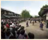
A7 太秦广隆寺站 徒步约5分钟

是在日本电影故乡“太秦”之地内的电影主题公园。可参观时代剧的拍摄，以及通过开放摄影场、各种活动以及游玩项目体验时代剧的世界！忍者表演和角色表演也非常有人气。