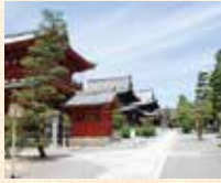
B6 妙心寺站 徒步约3分钟

花园法王将离宫改建成的禅寺，最初由关山慧玄开山。广阔的山内有四十六个塔头。法堂的天花板上有关野探幽画的云龙图。