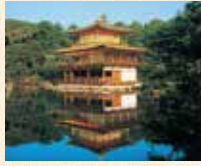
B9 北野白梅町站 徒步约15分钟

是相国寺的塔头寺院，舍利殿外墙的金阁装饰非常有名，因此又被称为“金阁寺”。是足利义满死后，由梦窗国师开山将山庄作为寺庙。