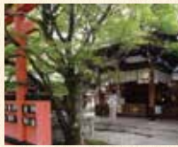
A10 车折神社站下车即到

平安时代后期的儒学者、清原赖业被作为祭神。作为能量点而非常有人气的“净化之社”、境内的艺术神社也有很多艺人到访。