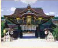
B9 北野白梅町站 徒步约5分钟

是祭学问之神的官原道真公的全国天满宫的总本社。是作为京都屈指可数的名胜而为人所知。春天的梅花、秋天的红叶苑对外开放。每月25日的庙会都有众多的参拜者前来，非常热闹。