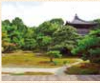
A11 鹿王院站徒步约4分钟

足利义满为祈求延年益寿而建造了觉雄山宝幢寺。作为开山塔建造鹿王院时，出现了野鹿群，据说这是其名称的由来。宝幢寺在应仁之乱中被烧毁，但是鹿王院得到重建，如今依然保留着往昔的身姿。红叶也很美丽，很受欢迎。