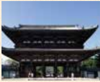
B5 御室仁和寺站 徒步约3分钟

由光孝天皇做了建立的祈愿，之后由宇多天皇创建了旧御室御所的门迹寺院。境内有很多值得观赏的景点，精细极美的御殿以及迟开的樱花“御室樱”都很有名。