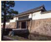
A1 四条大宫站 徒步或者转乘公交

是作为德川幕府的据点而建造的平城。之后又进行了大修缮。国宝的二之丸御殿、大手门及角楼、本丸御殿等都是重要文化财产。二之丸庭园是国家的特别名胜。