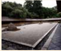
B7 龙安寺站 徒步约7分钟

细川胜元创建。由十五块石头和白沙构成的石庭非常有名。水户光圀捐赠的“知足之蹲踞”以及枫叶季节的镜容池也非常有人气。