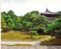
A17 鹿王院站徒步約4分鐘

足利義滿為祈求延年益壽而建造了覺雄山寶幢寺。作為開山塔建造鹿王院時，出現了野鹿群，據說這是其名稱的由來。寶幢寺在應仁之亂中被燒燬，但是鹿王院得到重建，如今依然保留著往昔的身姿。紅葉也很美麗，很受歡迎。