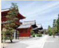
B6 妙心寺站 徒步約3分鐘

花園法王將離宮改建成的禪寺，最初由關山慧玄開山。廣闊的山內有四十六個塔頭。法堂的天花板上有關野探幽畫的雲龍圖。