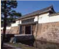
A1 四條大宮站 徒步或者轉乘公交 A5 嵐電天神川站轉乘地鐵東西線到「二條城前站」下車即到

是作為德川幕府的據點而建造的平城。之後進行了大修築。國寶的二之丸御殿、大手門及角樓、本丸御殿等都是重要文化財產。二之丸庭園是國家的特別名勝。