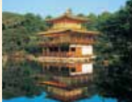
B9 北野白梅町站 徒步約15分鐘

是相國寺的塔頭寺院，舍利殿外牆的金閣裝飾非常有名，因此又被稱為「金閣寺」。足利義滿死後，由夢窗國師開山將山莊作為寺廟。