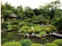
B8 等持院·立命館大學站 徒步約5分鐘

創建人為足利尊氏。是足利將軍的菩提寺，歷代將軍的木像被安置在那裡。傳說由夢窗疏石做的2個庭園中的芙蓉池與心字池的中間是尊氏的墓，在上面建了寶篋印塔。