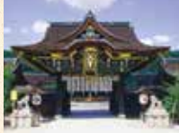
B9 北野白梅町站 徒步約5分鐘

是祭供學問之神的官原道真公的全國天滿宮的總本社。是作為京都屈指可數的名勝而為人所知，春天的梅花、秋天的紅葉苑對外開放。每月25日的廟會都有眾多的參拜者前來，非常熱鬧。