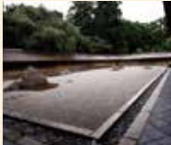
B7 龍安寺站 徒步約7分鐘

細川勝元創建。由十五塊石頭和白沙構成的石庭非常有名。水戶光圀捐贈的「知足之躡蹠」以及楓葉季節的鏡容池也豐富有人氣。