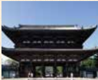
B5 御室仁和寺站 徒步約3分鐘

由光孝天皇做了建立的祈願，之後由宇多天皇創建了舊御室御所的門跡寺院。境內有很多值得觀賞的景點，精細精美的御殿以及遲開的櫻花「御室櫻」都很有名。