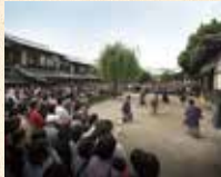
A7 太秦廣隆寺站 徒步約5分鐘 B1 攝影所前站 徒步約2分鐘(攝影所口)

是在日本電影故鄉「太秦」之地內的電影主題公園。可參觀時代劇的拍攝，以及通過開放攝影場、各種活動以及遊玩項目體驗時代劇的世界！忍者表演和角色表演也非常有人氣。