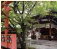
A10 車折神社站下車即到

平安時代後期的儒學者、清原賴業被作為祭神。作為能置點而非常有人氣的「淨化之社」、境內的藝能神社也有很多藝人到訪。