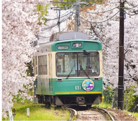
嵐電「江ノ電号」 (モボ 631形 631号車)