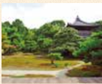
A11 鹿王院站徒步约4分钟

足利义满为祈求延年益寿而建造了觉雄山宝幢寺。作为开山塔建造鹿王院时，出现了野鹿群，据说这是其名称的由来。宝幢寺在应仁之乱中被烧毁，但是鹿王院得到重建，如今依然保留着往昔的身姿。红叶也很美丽，很受欢迎。