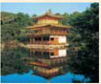
B9 北野白梅町站 徒步约15分钟

是相国寺的塔头寺院，舍利殿外墙的金阁装饰非常有名，因此又被称为“金阁寺”。是足利义满死后，由梦窗国师开山将山庄作为寺庙。