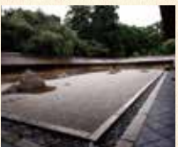
B7 龙安寺站 徒步约7分钟

细川胜元创建。由十五块石头和白沙构成的石庭非常有名。水户光圀捐赠的“知足之踏踏”以及枫叶季节的镜容池也非常有人气。