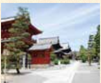
B6 妙心寺站 徒步约3分钟

花园法王将离宫改建成的禅寺，最初由关山慧玄开山。广阔的山内有四十六个塔头。法堂的天花板上有关野探幽画的云龙图。