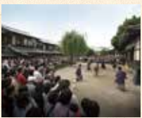
A7 太秦广隆寺站 徒步约5分钟

是在日本电影故乡“太秦”之地内的电影主题公园。可参观时代剧的拍摄，以及通过开放摄影场、各种活动以及游玩项目体验时代剧的世界！忍者表演和角色表演也非常有人气。