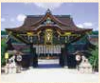
B9 北野白梅町站 徒步约5分钟

是祭学问之神的官原道真公的全国天满宫的总本社。是作为京都屈指可数的名胜而为人所知。春天的梅花、秋天的红叶苑对外开放。每月25日的庙会都有众多的参拜者前来，非常热闹。