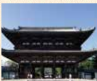
B5 御室仁和寺站 徒步约3分钟

由光孝天皇做了建立的祈愿，之后由宇多天皇创建了旧御室御所的门迹寺院。境内有很多值得观赏的景点，精细极美的御殿以及迟开的樱花“御室樱”都很有名。