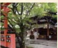
A10 车折神社站下车即到

平安时代后期的儒学者、清原赖业被作为祭神。作为能量点而非常有人气的“净化之社”、境内的艺术神社也有很多艺人到访。