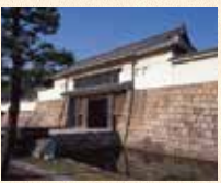
A1 四条大宫站 徒步或者转乘公交

是作为德川幕府的据点而建造的平城。之后又进行了大修缮。国宝的二之丸御殿、大手门及角楼、本丸御殿等都是重要文化财产。二之丸庭园是国家的特别名胜。