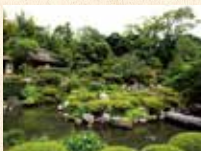
B8 等持院·立命馆大学站 徒步约5分钟

创建人为足利尊氏。是足利将军家的菩提寺，历代将军的木像被安置在那里。传说由梦窗疎石做的2个庭园中的芙蓉池与心字池的中间是尊氏的墓，在上面建了宝篋印塔。