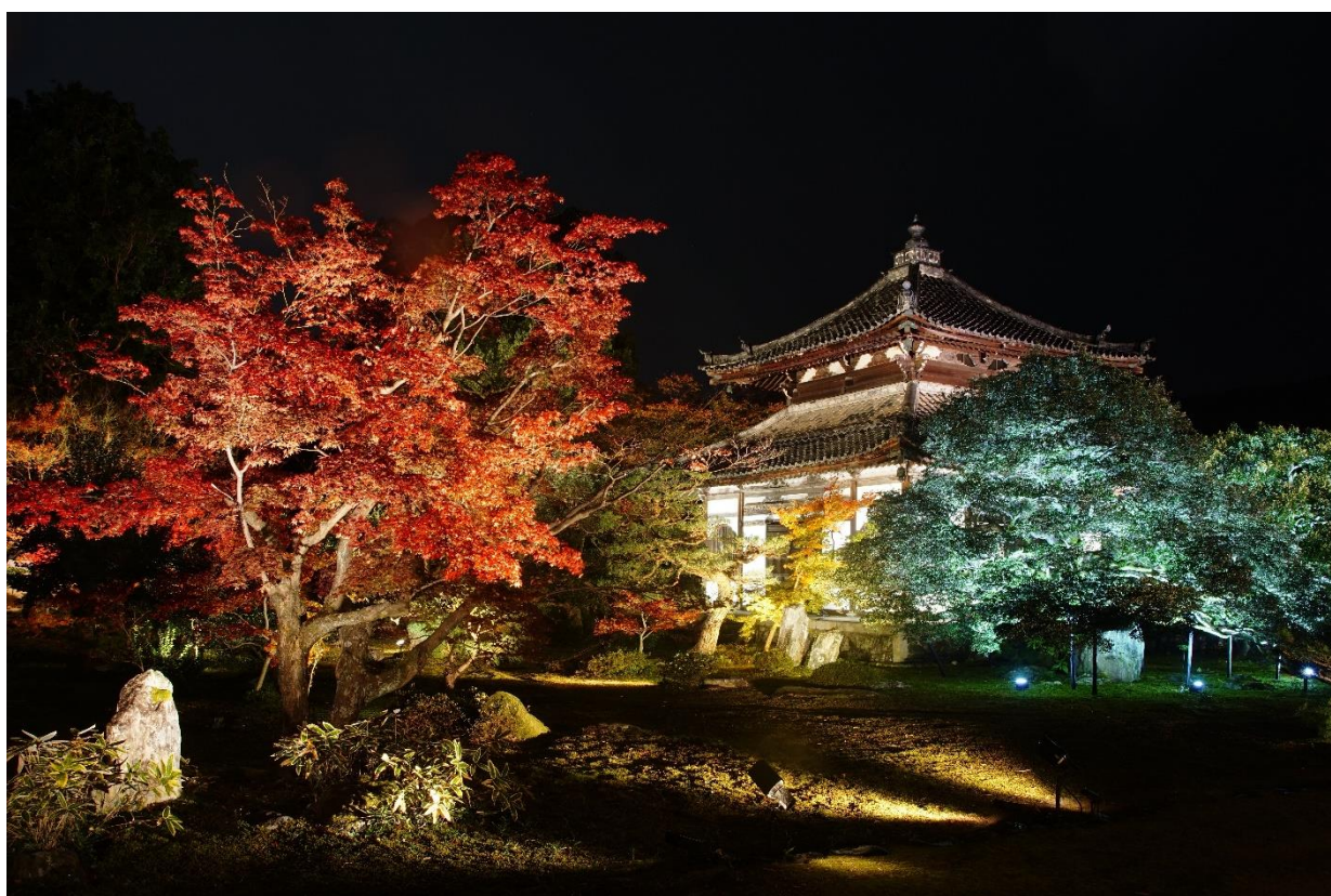
ライトアップされた舍利殿と庭園 (2018 年撮影)