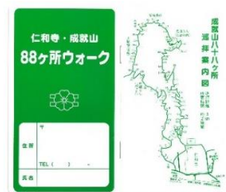
88ヶ所ウォーク ラリー帳

通常、イベント期間外はスタンプを設置していませんが、今回、御室仁和寺様のご協力により、チケット発売期間中、スタンプを常設します。