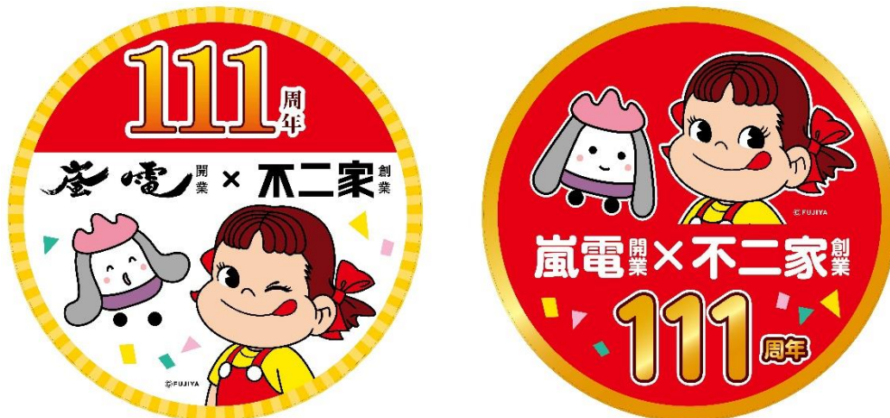
新ヘッドマーク（イメージ）

2020年3月に開業110周年を迎えた嵐電のマスコットキャラクター「あらん」と、11月に創業110周年を迎えた株式会社不二家のマスコットキャラクター「ペコちゃん」を車内外にラッピングでデザインしたコラボレーション電車が、当初の運行予定期間を1年延長、「111周年ラッピング電車」として2022年3月24日（木）まで運行します。基本的なデザインは同じですが、ヘッドマークのデザインを変更します。