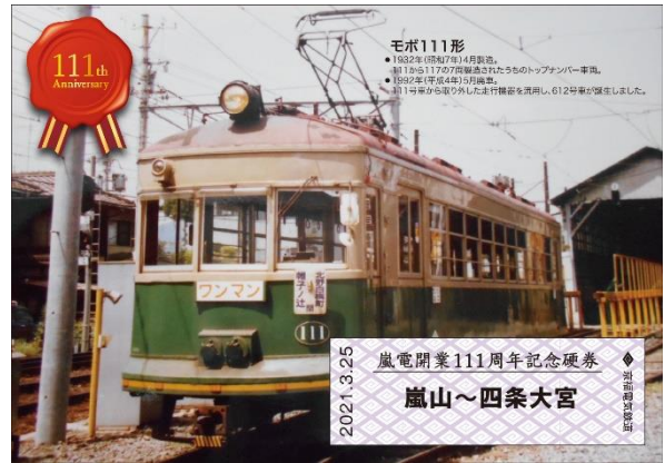
硬券本体（上）とパッケージイメージ（右）