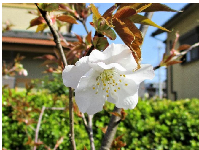
御室仁和寺駅の桜（左右とも2021年3月31日9時頃撮影）