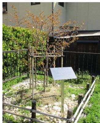
植樹された御室桜