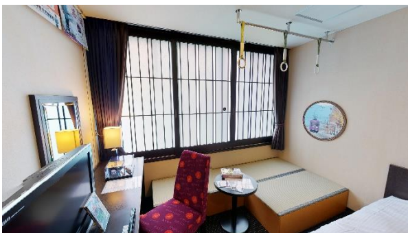
▲畳スペース、つり革、優先席シートモケット