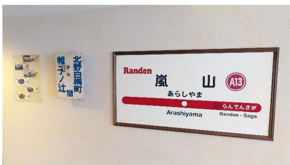
▲記念乗車券・旧行先方向板・駅名標