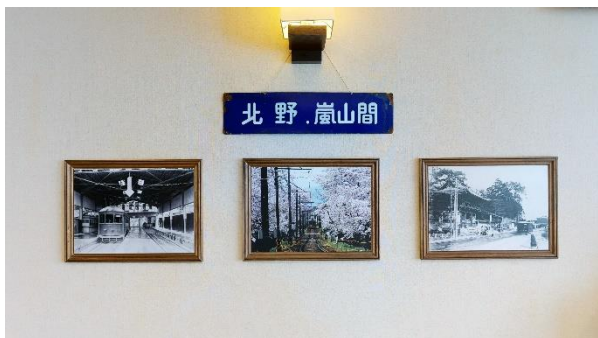
▲嵐電北野線パネル・行先方向板