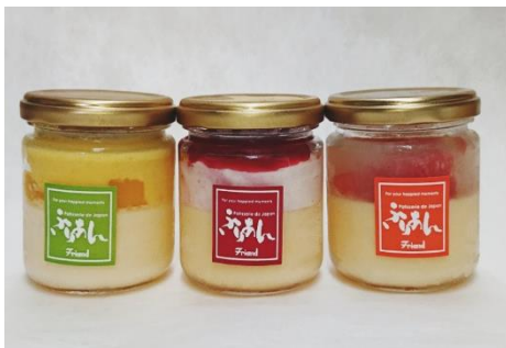
「Bottle Sweets」500円 (ふりあん嵐山店)

「嵐山駅はんなり・ほっこりスクエア」に新たに2店舗がオープン、 さらに1店舗がリニューアルオープンします！