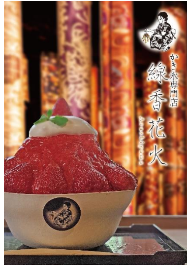
「莓山」2,500円 (線香花火 ~Arashiyama~)