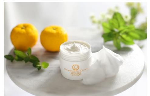
「とろみ和洗顔 柚子」100g 2,178円 (嵐山桃肌こすめ)